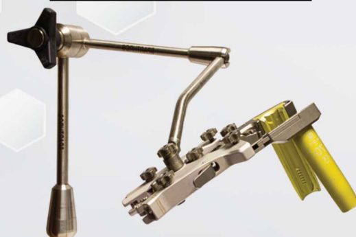
Retractor Phantom y brazo Articulado