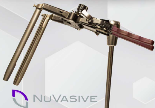
Retractor Lumbar Maxcess