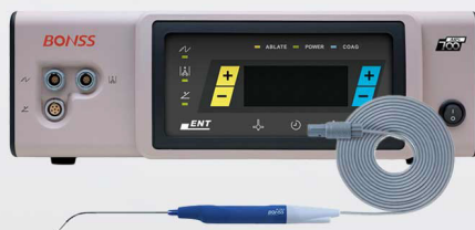
Radiofrecuencia de Plasma Bonss

Punta en forma de pistola para ablacion o coagulación