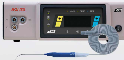
Radiofrecuencia de Plasma Bonss

Punta en forma de pistola para ablacion o coagulacion