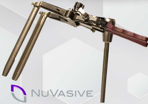
Retractor Lumbar Maxcess