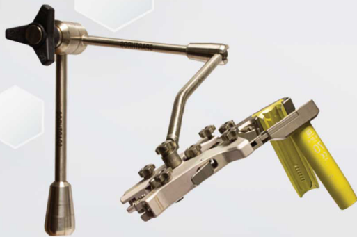
Retractor Phantom y brazo Articulado