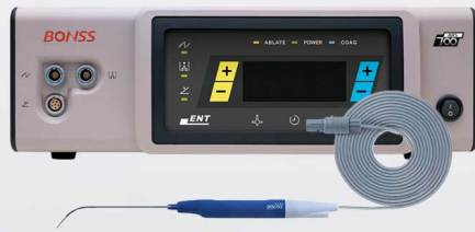
Radiofrecuencia de Plasma Bonss

Punta en forma de pistola para ablacion o coagulación