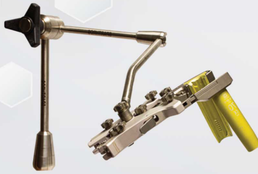
Retractor Phantom y brazo Articulado