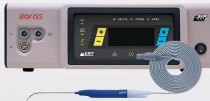
Radiofrecuencia de Plasma Bonss

Punta en forma de pistola para ablacion o coagulacion