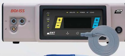
Radiofrecuencia de Plasma Bonss

Punta en forma de pistola para ablacion o coagulacion