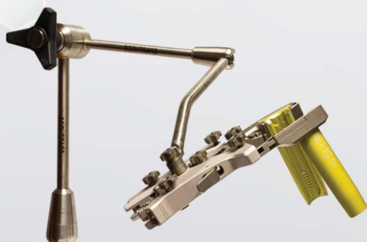
Retractor Phantom y brazo Articulado