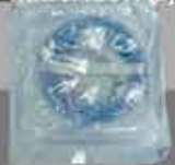
TUBERIA DE IRRIGACIÓN (2)