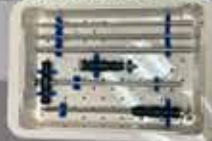
INSTRUMENTAL PARA COLOCACIÓN